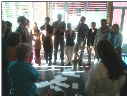
Grupo de formadores de toda Europa en el curso oficial para formadores realizado en Grenoble, Francia. Noviembre 2011