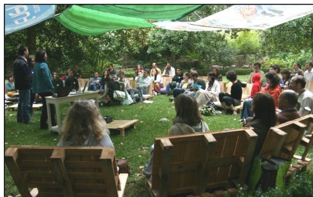
Curso oficial de Transición realizado en Sintra, Portugal. Septiembre 2011